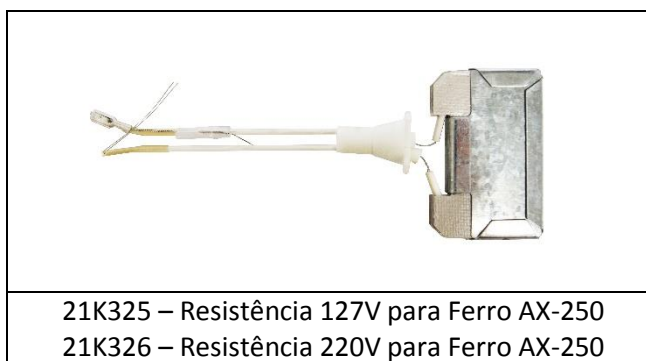
21K325 – Resistência 127V para Ferro AX-250 21K326 – Resistência 220V para Ferro AX-250